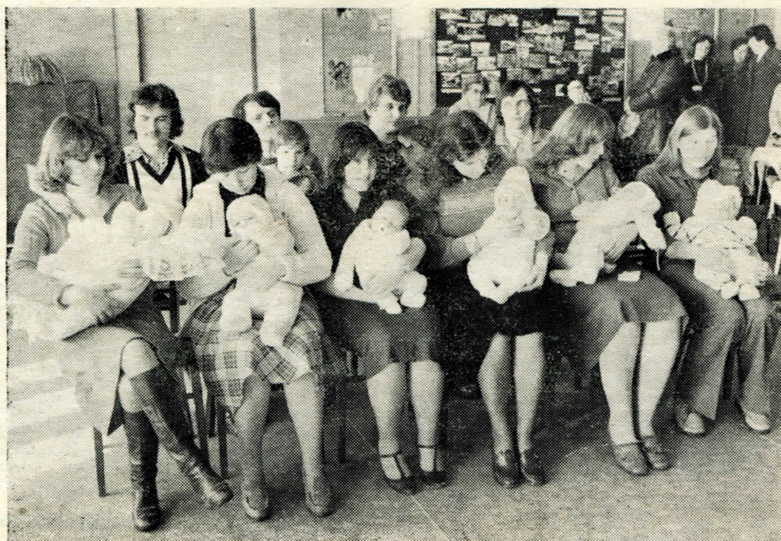
Z posledního vítání nových občánek v Černém Dole.