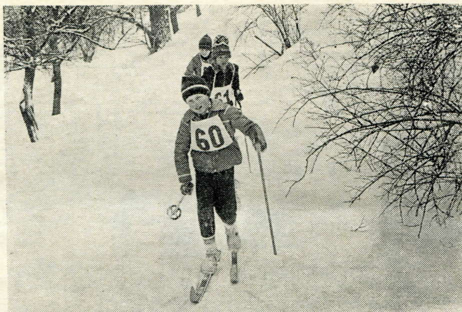
Z lyžařského závodu, který pořádaly složky NF na počest výročí Února.